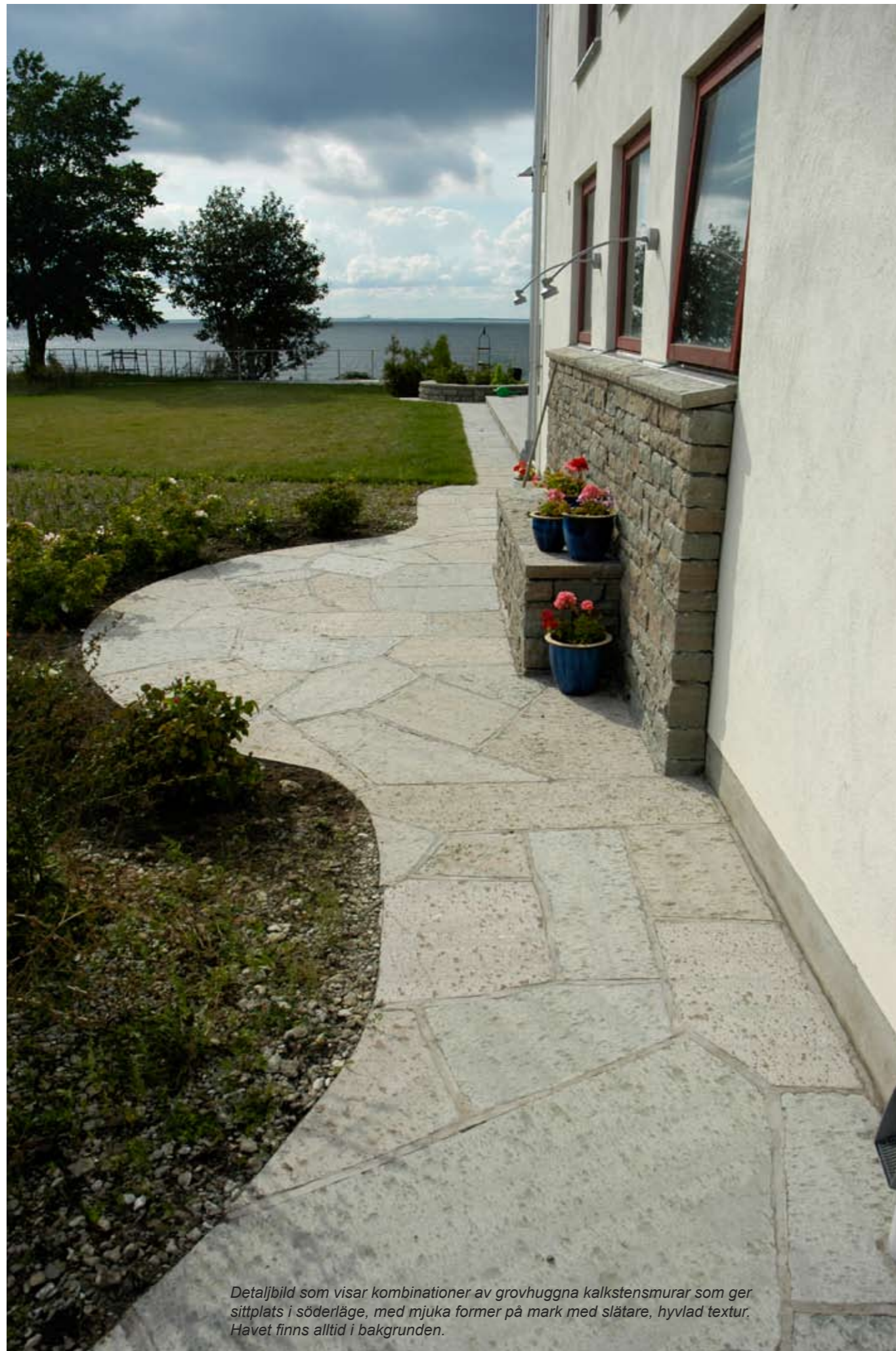
Detaljbild som visar kombinationer av grovhuggna kalkstensmurar som ger sittplats i söderläge, med mjuka former på mark med slätare, hyvlad textur. Havet finns alltid i bakgrunden.