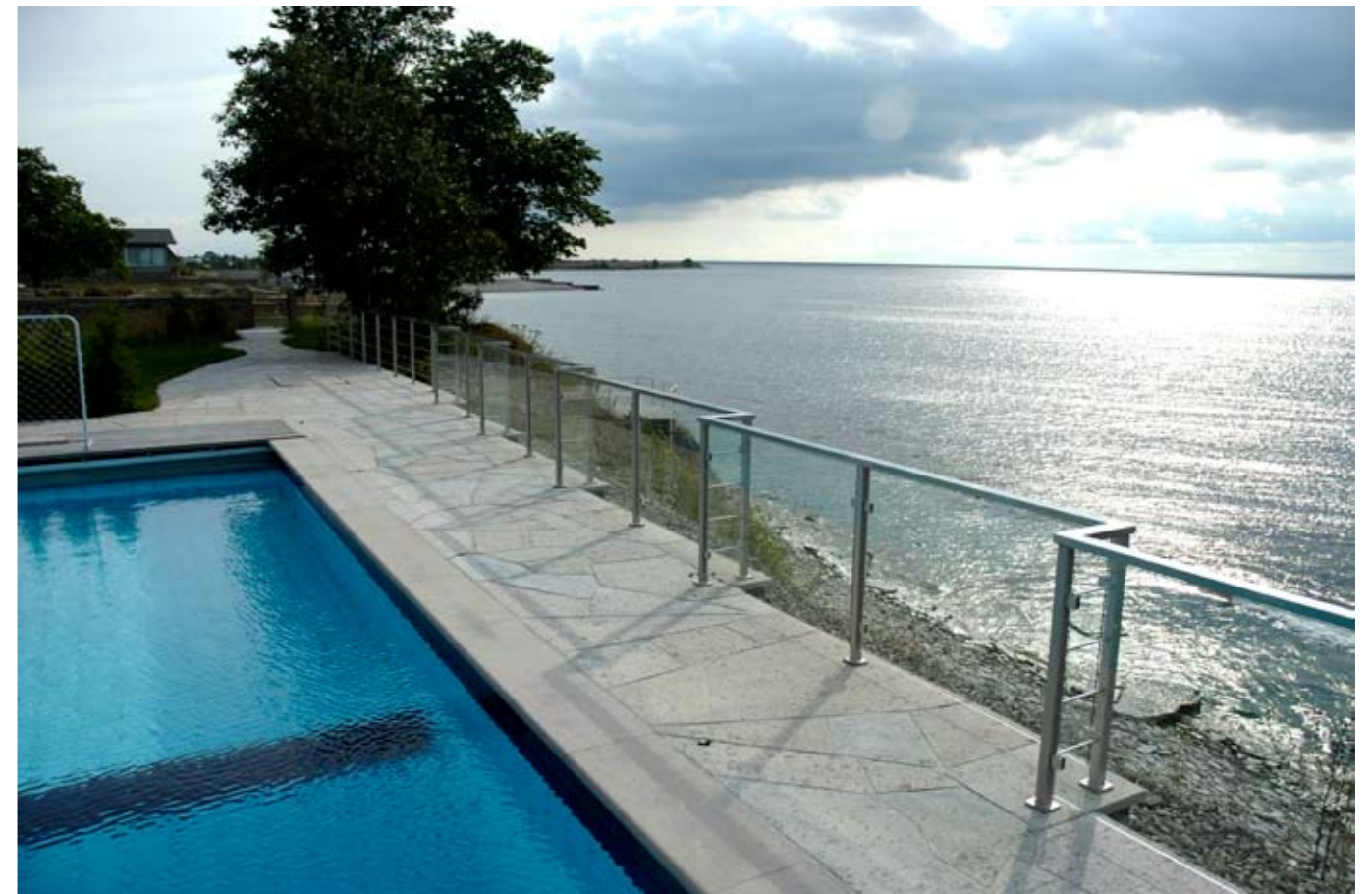
Längs poolområdet med utblick mot havet i väster kontrasterar kalkstensmurar mot glas och metallräcken som ger skydd mot den branta sluttningen utan att minska den oändliga utsikten över Kalmarsund.

massivgolv av trä valts för att skapa en varm och trivsamt miljö.